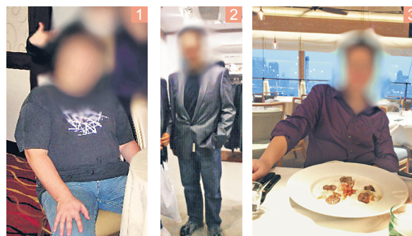
一名患有糖尿病的男病人本來體形碩大（圖一），接受縮胃手術後顯著減磅（圖二及三）。

曾醫生強調，縮胃手術只是控制糖尿病的第一步，因為手術後病人需要在生活模式及心理方面作出跟進和調節，例如初期只能進食流質食物，並且要控制進食的速度和份量，更要確保在吃很少之餘也攝取到足夠的營養，在各方面配合下方能令身體重拾健康，真正解除糖尿病的威脅。