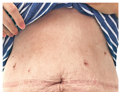
以腹腔鏡進行的微創縮胃手術，只會在病人的腹部留下幾個細小的傷口。

胃。因此在手術後病人的體重會明顯減輕，令糖尿病等肥胖相關的疾病大有改善，有些病人連血壓及睡眠窒息症也有好轉。