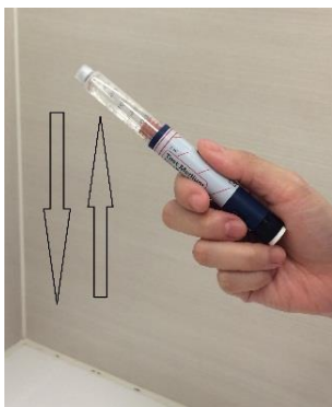
(圖一) 搖動藥水方法