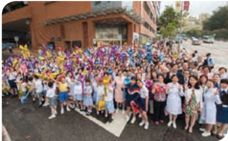
300名長者及不同級別的學生一同挑戰健力士世界紀錄

浸會醫院深明手部衛生對疾病控制的重要，近年積極提高醫護人員對手部衛生的意識。去年的5月5日世界潔手日，本院號召277名醫護人員圍繞醫院D座及E座大樓，以接力形式用酒精搓手液進行潔手七部法，成功創下了「最多人參與潔手接力」(Most Participants In A Hand Sanitising Relay) 的新健力士世界紀錄。