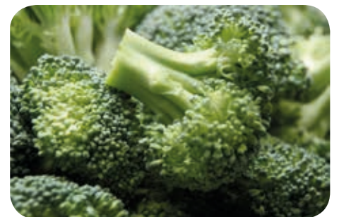
營養師建議每日三餐進食最少一碗蔬菜、瓜或菇類，以控制飲食中的碳水化合物的攝取量、澱粉質及糖類的吸收速度