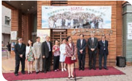
食物及衛生局副局長陳肇始教授太平紳士蒞臨此活動致辭及主持鳴笛啟動禮

今年的5月5日，本院更進一步向社區出發，舉辦「社區參與潔手接力 再創健力士世界紀錄活動」，邀請了300名長者及不同級別的學生參加，包括區樹洪健康中心的長者、獻主會聖馬善樂小學、藍田循道衛理小學、北角循道衛理小學、衛理道(循道學校)、培道中學、香港公開大學及浸會護士學校的學生，藉此再一次挑戰健力士世界紀錄。今次也跟去年一樣，參加者圍繞醫院兩座大樓，完成潔手七部法，然後