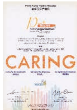
「10年Plus同心展關懷標誌」獎狀