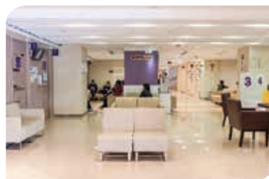
候診室較以前寬敞，玻璃幕牆滲透天然光，感覺開揚、舒適

門診部與 E 座地下接連，提供 24 小時的 X 光及電腦掃描服務。另有藥房、入院登記及繳費處，提供一站式服務。