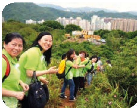
同事們身體力行，以實際行動表達對環境保育之關注

在來年，醫院定當繼續肩負社會責任，贊助相關活動的同時，亦鼓勵和關顧社區及保育環境之文化。