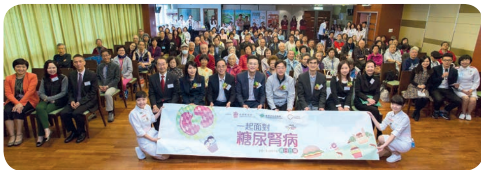
逾過百名市民參與活動，並大合照留念