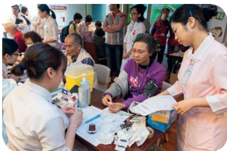
參加者於現場進行血糖測試