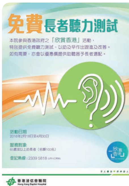
免費長者聽力測試海報

作為一間非牟利的私營醫院，浸會醫院會將盈餘用作持續醫療發展，並會藉著醫療專業向社會各界延展關懷，實踐「全人醫治·榮神益人」的宗旨，幫助更多有需要的市民，履行企業社會責任。有關其他慈善及社會企業項目，可瀏覽網頁 ( http://www.hkbh.org.hk/chi/corporate_social_responsibility.php )。