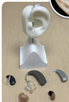
不同類型助聽器的功能及外形設計都有所不同，未必會影響配戴者的外觀。例如右下角的全隱蔽耳道式助聽器，配戴後不易被人發覺。