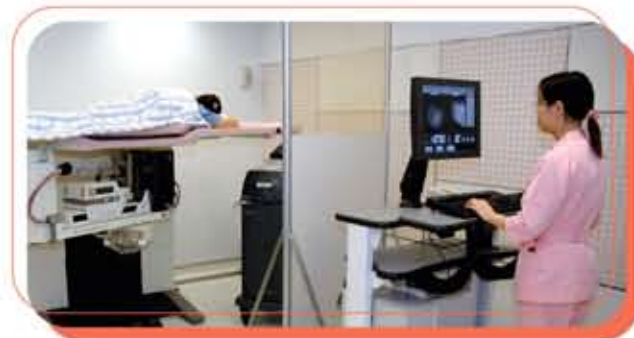
俯臥式乳房活組織立體定位檢查系統

本中心提供多項先進的檢驗方法，包括幼針管抽吸術、針管抽取活組織檢驗、麥瑪通® 乳房入刀技術 (Mammotome®) 及導絲定位活組織檢驗。專科醫生按每位病人的特別需要，為他們挑選和及早安排合適的檢查，絕不耽誤病情。