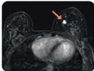
透過磁力共振掃描找到懷疑病變的乳房組織