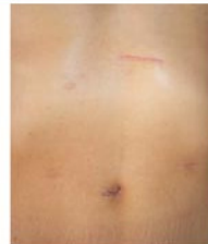
微創腹腔鏡胃癌切除後疤痕較小