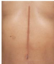
傳統的開放式胃癌切除手術後留下較大的疤痕

較小的傷口除了能減少痛楚外，留下的細小疤痕也能隱藏在較難察覺的位置，傷口受感染等併發症的機會也大大減少。