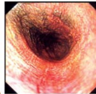
4 手術後2個月食道完全愈合

較小的傷口除了能減少痛楚外，留下的細小疤痕也能隱藏在較難察覺的位置，傷口受感染等併發症的機會也大大減少。