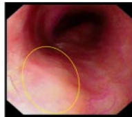
1 早期食道癌在一般內視鏡下識別較困難

內視鏡手術是透過身體之天然孔口（例如：口腔）或皮膚上的小切口，把內視鏡和精細的儀器放入體內進行手術。相比傳統的開放式大切口手術，內視鏡手術的疤痕細小或完全沒有疤痕（無創），因而能有效地減少手術帶來的創傷和痛楚，使病人在術後能較更快康復出院。